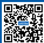
电子科技大学 在线申请平台