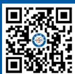
电子科技大学 英文官方网站